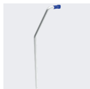
En option : rampes simples 02380932