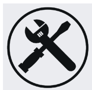
Produit à monter. Consultez la notice.