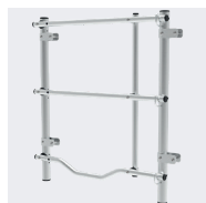
En option : portillon 02380945