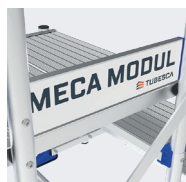
Plinthes 100 mm