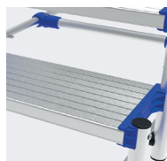
Marches profondes 250 mm, striées antidérapantes.