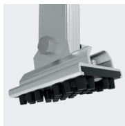
Patins pivotants antidérapants pour s'adapter à toutes les situations