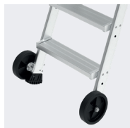
Anneaux de grutage de série