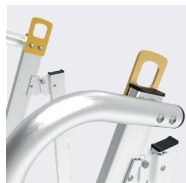
Roues pour faciliter le déplacement