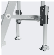
Pieds télescopiques au niveau de la plate-forme