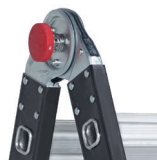
Articulations robustes à verrouillage automatique