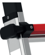
Verrouillage de l'échelon