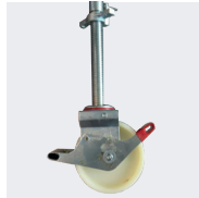
Roues Ø200mm à blocages réglables sur le modèle 5,80m