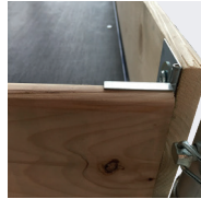
Plancher bois 1,81 x 0,61 m avec plinthes amovibles (pas de plinthe pour le modèle 0,75m)