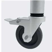
Roues Ø125mm anti-traces