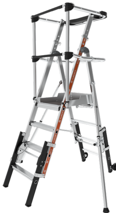
Modèle présenté : 02274920