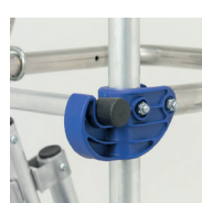
Ceinture de sécurité rigide à 360°