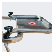
Tablette porte-outils en option Réf. 02272526