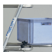
2 positions possibles pour la tablette porte-outils en option