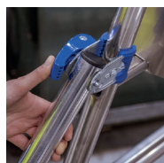
Système de blocage des stabilisateurs par Ergoblock®