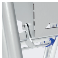
Verrou anti-soulèvement de la plate-forme

Livré sous emballage plastique rétractable. La plate-forme est comptée comme une marche.