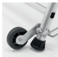
2 roulettes Ø 100 mm pour les déplacements