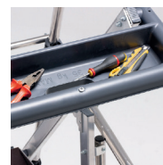
Tablette porte-outils grande capacité