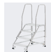
Modèle avec 2 rampes latérales et 1 kit roulettes

Option 1 rampe latérale : 02379814 - Option kit roulettes : 02379813