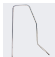
Kit rampe (vendu à l'unité) réf. 02379814