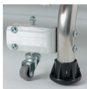
Roulettes amovibles en option en position travail réf. 02379813