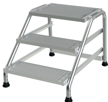
Modèle 3 marches

Ce marchepied tout en aluminium avec marches caillebotis en acier est disponible de 1 à 5 marches pour atteindre jusqu'à 3 mètres hauteur travail. Ses marches en caillebotis antidérapantes d'une largeur de 560 x 200 mm et sa plate-forme de 560 x 400 mm garantissent confort et sécurité dans les environnements les plus extrêmes.