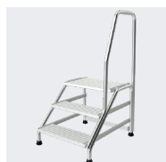
3 marches avec une rampe