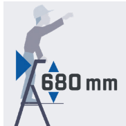
Maxi sécurité anti-basculement avant

Le repose-pieds est compté comme une marche. Livrés emballés sous film avec PLV