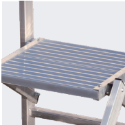
Grande surface du repose-pieds 400 x 400 mm