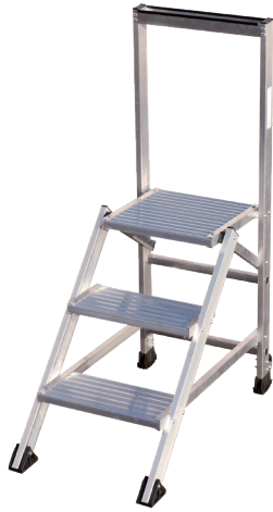
Modèle 3 marches

Le marche-pied Confort fixe dispose de marches extra larges et d'une plate-forme de 400 x 400 mm avec une structure renforcée faisant de lui un "escalier mobile". Ses surfaces striées et ses sabots antidérapants procurent une sécurité optimum. Il offre à ses utilisateurs un porte-outils en aluminium et des roues de déplacement disponibles en option. Il est conforme à la norme EN 14183 et au décret 96 333. Disponible en version 3 marches avec une hauteur d'accès maxi de 2,70 mètres.