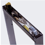
Porte-outils intégré dans le garde-corps