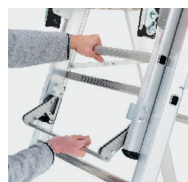
Travail possible près d'une paroi