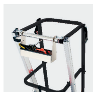
Porte-outils Verrouillage du plan coulissant