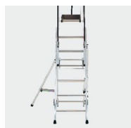
Utilisation pour la pose de faux plafonds