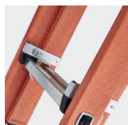
Verrouillage de sécurité du plan coulissant