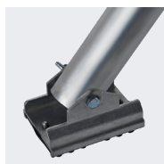
Platine de stabilisateur anti-dérivant orientable