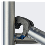
Système de liaison fiable en un seul geste