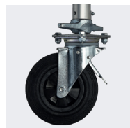
Roues Ø200 mm avec blocage surpuissant et réglage millimétrique