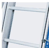
Échelons 30 x 30 mm