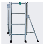
Utilisation possible contre un mur