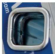
Ultra-résistance de l'échelon grâce au triple sertissage