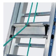
Coulisse à corde avec basculeur automatique en alu extrudé