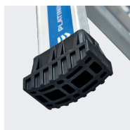
Sabots crantés antidérapants