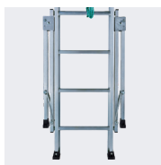
Stabilisateurs rabattables pour le stockage