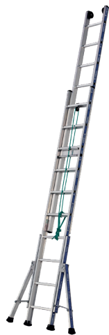
Modèle 2x10 échelons

L'échelle Platinum 300 coulisse à corde 2 plans en aluminium est la référence à coulisse corde du marché. Composée de 2 plans elle permet d'accéder jusqu'à 12,84 m. Ses stabilisateurs latéraux réglables, ses sabots enveloppants haute sécurité, ses montants extra larges garantissent sécurité et résistance. Elle répond aux normes EN 131, au décret 96333. Elle est labellisée NF.