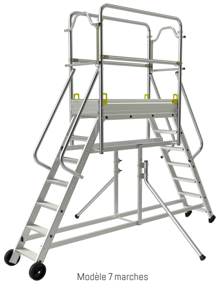
Modèle 7 marches

La passerelle banche en aluminium est l'outil indispensable de la construction. Grâce à son dimensionnement, ses différentes hauteurs jusqu'à 3,48 mètres, ses roues de déplacement et ses anneaux de grutage en série, elle sera s'intégrer parfaitement à l'intérieur de banches. Elle procurera aux professionnels du BTP / gros oeuvre un maximum de sécurité avec ses rampes et ses garde-corps rigides. Elle répond au décret 2004-924.