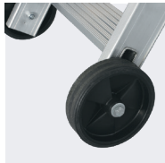
Roues Ø 160 mm