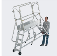
Déplacement sur 2 roues